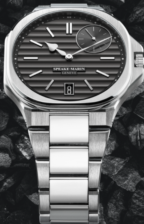
Speake Marin - Ripples Date