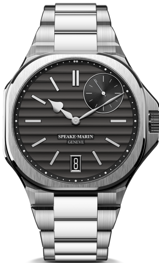
40.30 Acciaio inossidabile 604018040