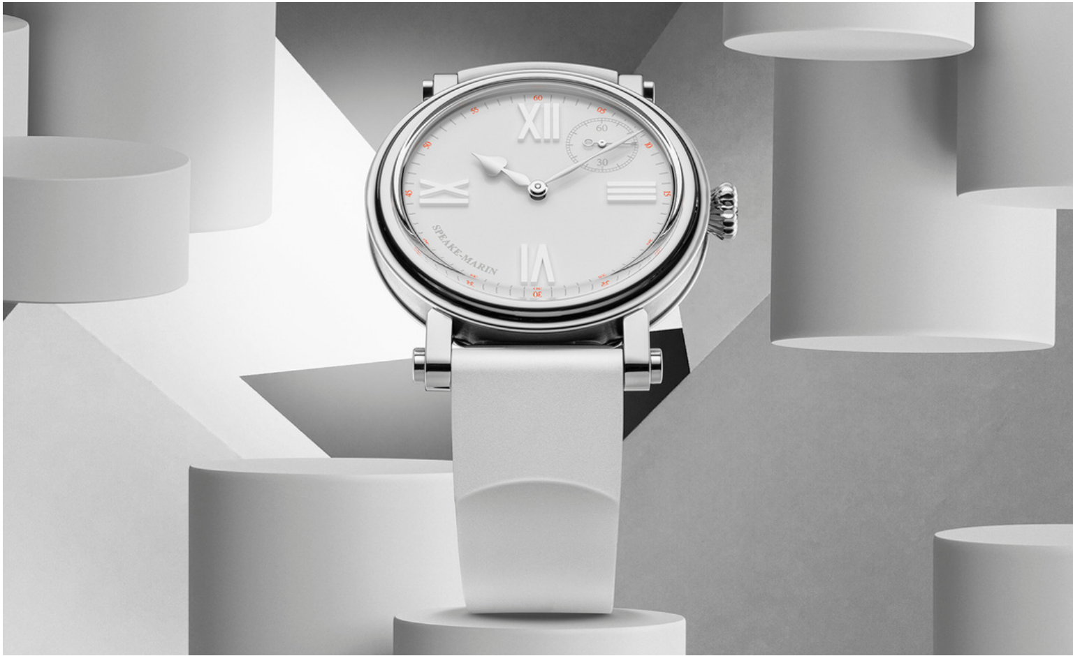
Speake Marin - Academic White (Edizione illimitata)