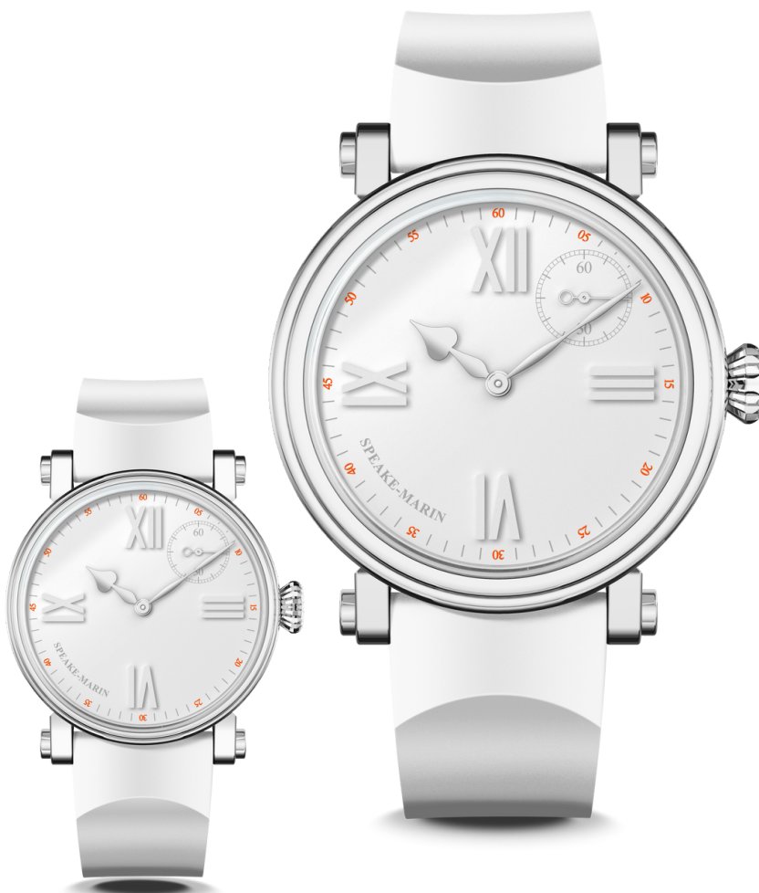
38Ø Titanium 413817000