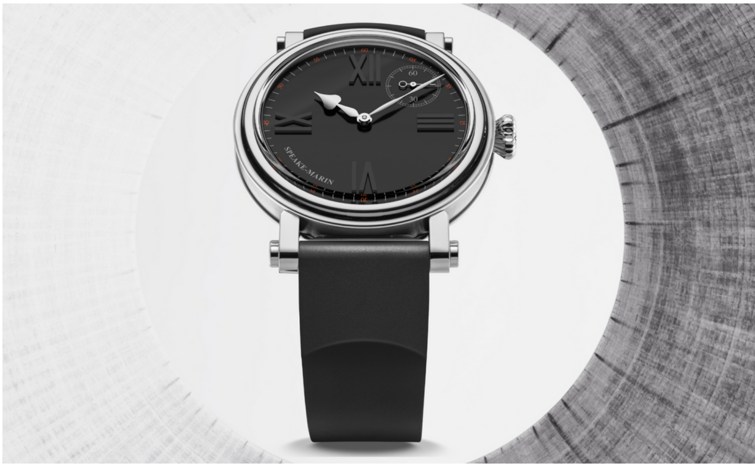
Speake Marin - Academic Black tie (Edizione illimitata)