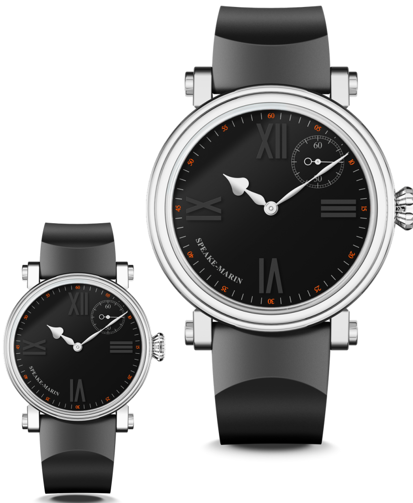
38Ø Titanium 413817040